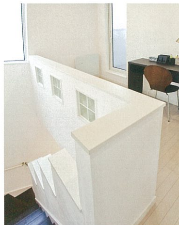
2F ホール、 プレイルーム

1st floor 50.31㎡(15.2坪) 2nd floor 48.23㎡(14.5坪) total floor 98.54㎡(29.8坪)