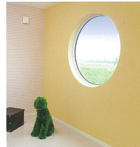
子供部屋 デザイン窓