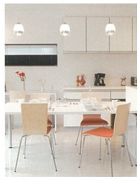
ダイニングキッチン (ビックテーブル)