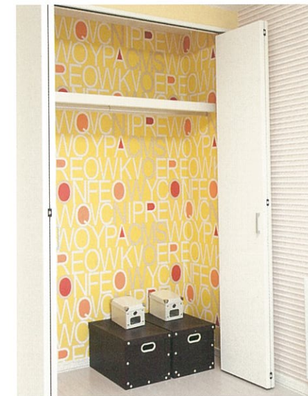
子供部屋 クローゼット