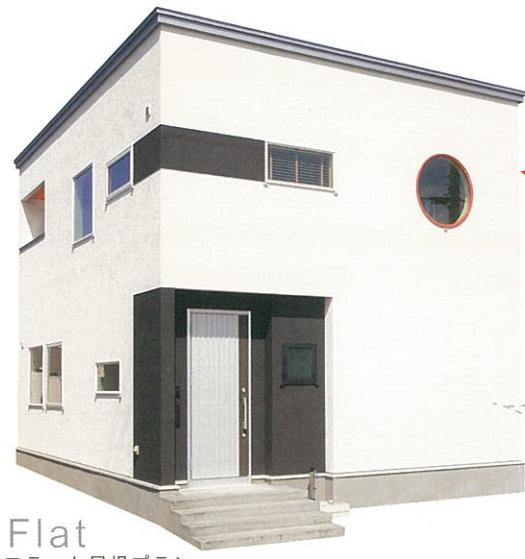
Flat フラット屋根プラン